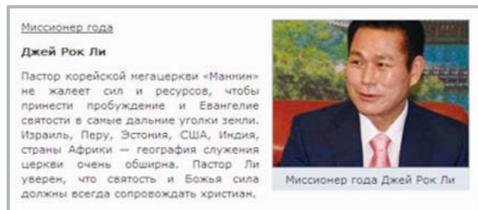
“今年最佳宣教事工者”李载禄牧师。李载禄牧师在2009年也同样被“胜利”和“基督教电报”选定为“今年最佳电视讲道人”，今年与李载禄牧师一同连续2年被选定为10大宣教事工者之一的还有瑞克·沃伦牧师。

▶ 今年的传道者布永康 (Reinhard Bonnke): 他正在引领非洲数百万灵魂归向主耶稣基督的怀抱, 并每天都在世界性的社交网站“脸谱网(Facebook)”投稿发表文章, 是一位年过70的传奇布道家。他确信互联网是巨大的传道空间。