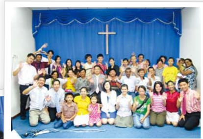
马来西亚六甲支教会