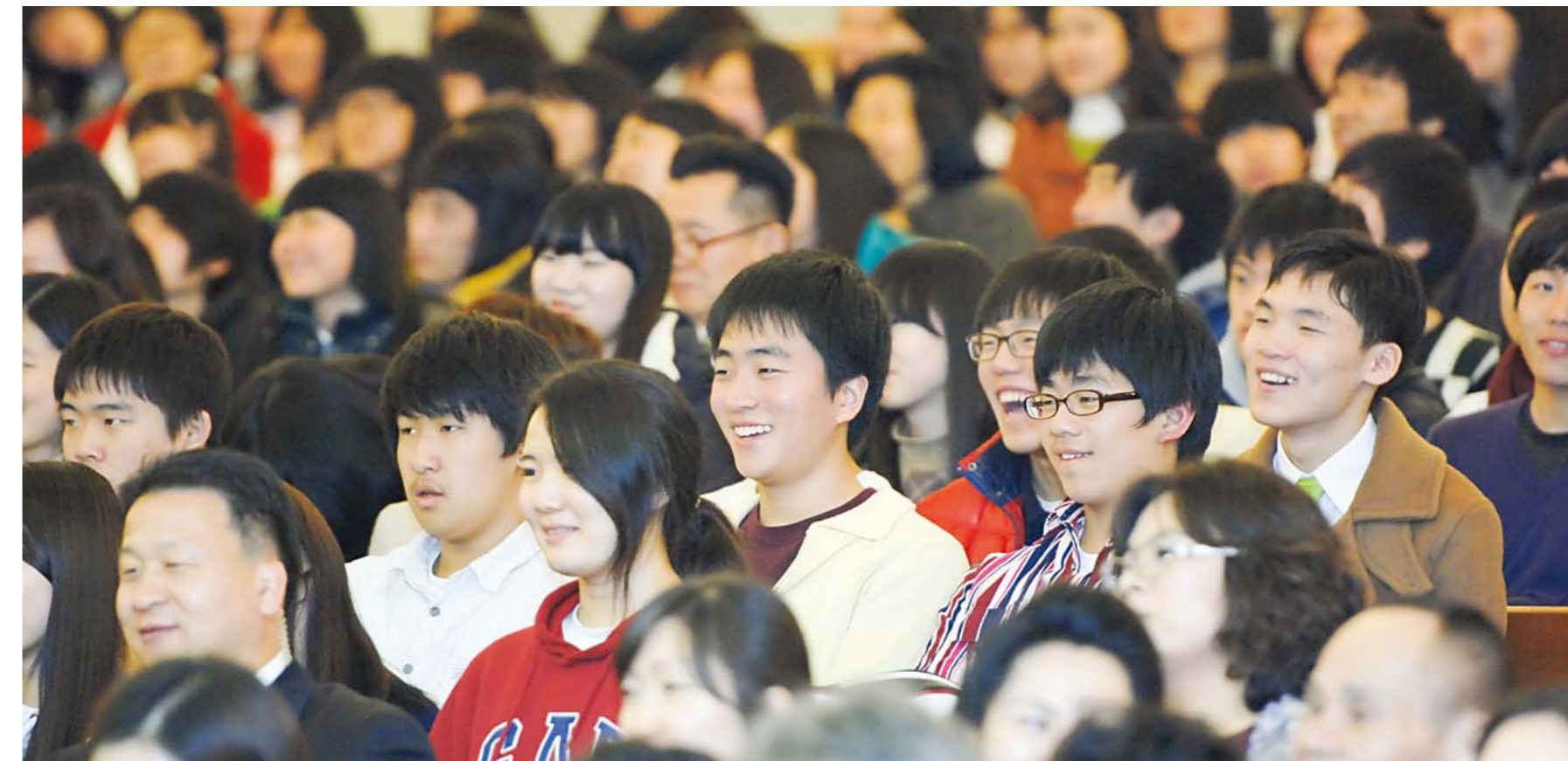
主日大礼拜时,兴致勃勃地聆听李载禄牧师讲道的学生和圣徒们。“学习的秘诀”系列讲道,不仅能应用在学业和就业、晋级考试和各种资格考试,尤其对信仰生活大有帮助。

新年伊始,本教会堂会长李载禄牧师在主日大礼拜时开始见证“学习的秘诀”(雅各书3:17-18、箴言9:10)系列讲道。