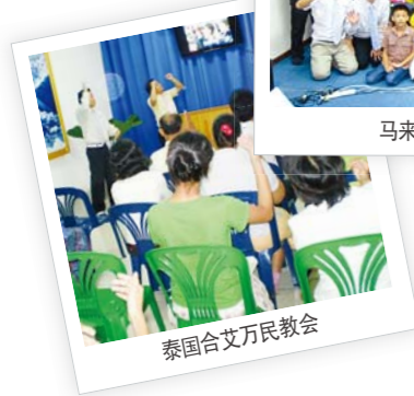
泰国合文万民教会