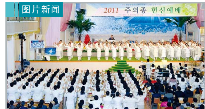
1月9日主日献身礼拜时,全体献身者们向神献上颂赞,将荣耀归给了神。