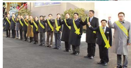
不受“冬将军”凛冽气势的影响，因主的恩典教会各个角落充满着活力。高喊“奔向新耶路撒冷运动”相关细则的学生主日学校的学生们(图片上方)及主日早上迎接圣徒们的长老会会员们。