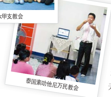
泰国素叻他尼万民教会

我曾经是一名同性恋者。并且我又是一名聋哑人,所以未能过一个正常人的生活。即便试着接触伊斯兰教或者佛教,也都未能从中得到帮助。22岁时,我开始出席马来西亚檳榔嶼的聋哑教会,然而,我并没有好好信主,仍旧没能找到人生的意义。