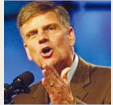
葛培理布道协会代表 葛福临