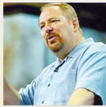
美国马鞍峰教会堂会长 瑞克·沃伦