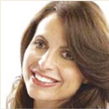
女性基督领导人 丽莎·伯维雨