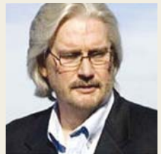
美国文化历史学家兼未来研究家 伦纳德·斯威特

1月4日，最大的俄文基督教门户网站“胜利”(www.invictory.org)是全世界60个国家中使用俄语的基督徒访问的最具影响力的门户网站和15日英文基督教门户网站“基督教电报”(www.christiantelegraph.com)评选并介绍了“10位2010年最具有影响力的宣教事工者”。