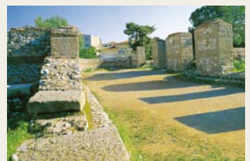
推雅推喇教会遗址