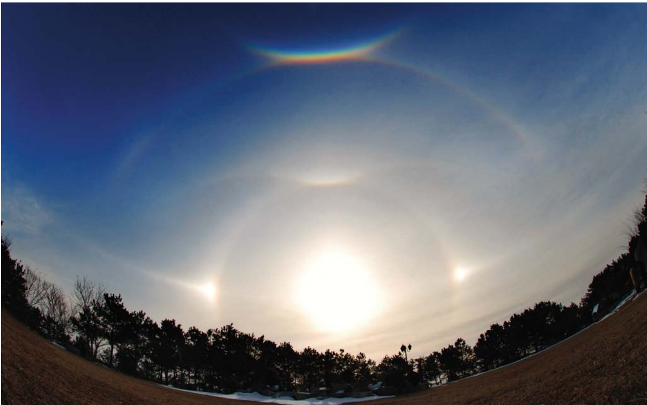
1月27日上午9点30至10点30分之间,在务安万民教会的甜水池(全罗南道务安郡海济面天长里山153番地)上空复合呈现圆形彩虹以及呈奇特形状的各种彩虹。(摄影:金新冷 Nikon D80, Fisheye 10.5mm, 1/500, f/11, ISO 200, 20110127_093433).

1月27日上午9点30分,圣经出埃及记15章中记录的奇事再现之地——务安甜水池(参照第三版面)上空出现了奇特形状的彩虹。这是一个复合型彩虹,整整一个多小时挂在天空,谓为壮观。其形状如下:围绕太阳出现的圆形彩虹上方左右两边呈现镶嵌如钻石的两个光点,又从那光点延伸出一个大圆形彩虹,而且在12点方位叠现飞鹤翅膀形状的彩虹,又有半圆形彩虹围绕在其上,在其12点方位又叠现着鲜明的扇形彩虹。