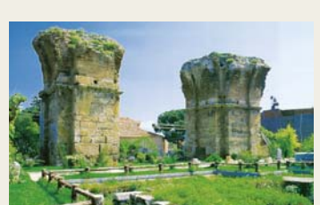
非拉铁非教会遗址