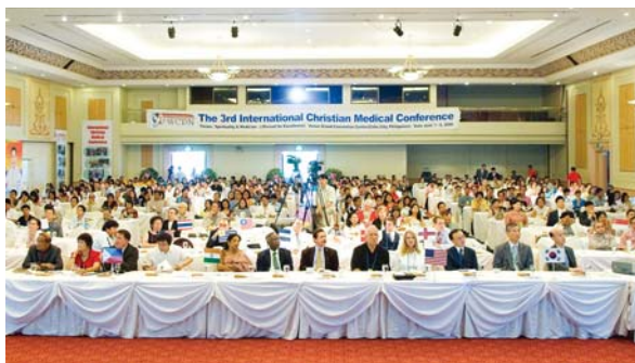
每年全世界基督医生们聚在一起通过医治的事例，见证永生神和圣经是真实的这医学研讨会，在印度金奈、菲律宾宿务、美国迈阿密、挪威特隆赫姆、乌克兰基辅、意大利罗马等地召开。

医治各样疾病，彰显非常奇事的使徒保罗 使徒保罗用大权能见证了永活的真神及耶稣基督。 得到神的权能，神迹和奇事就会伴随我们，而且随着权能阶段的提高， 还能彰显非常的奇事和奇妙的神迹。为了达到这样的权能阶段， 必须要靠如火般的祷告，将各样的恶事除去净尽，并积累充足的祷告馨香。