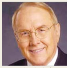
“爱家协会”创建人 詹姆斯·杜布森