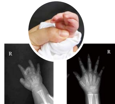
接受祷告前(2008年7月30日,出生5个月) 接受祷告后(2010年3月5日,出生27个月)