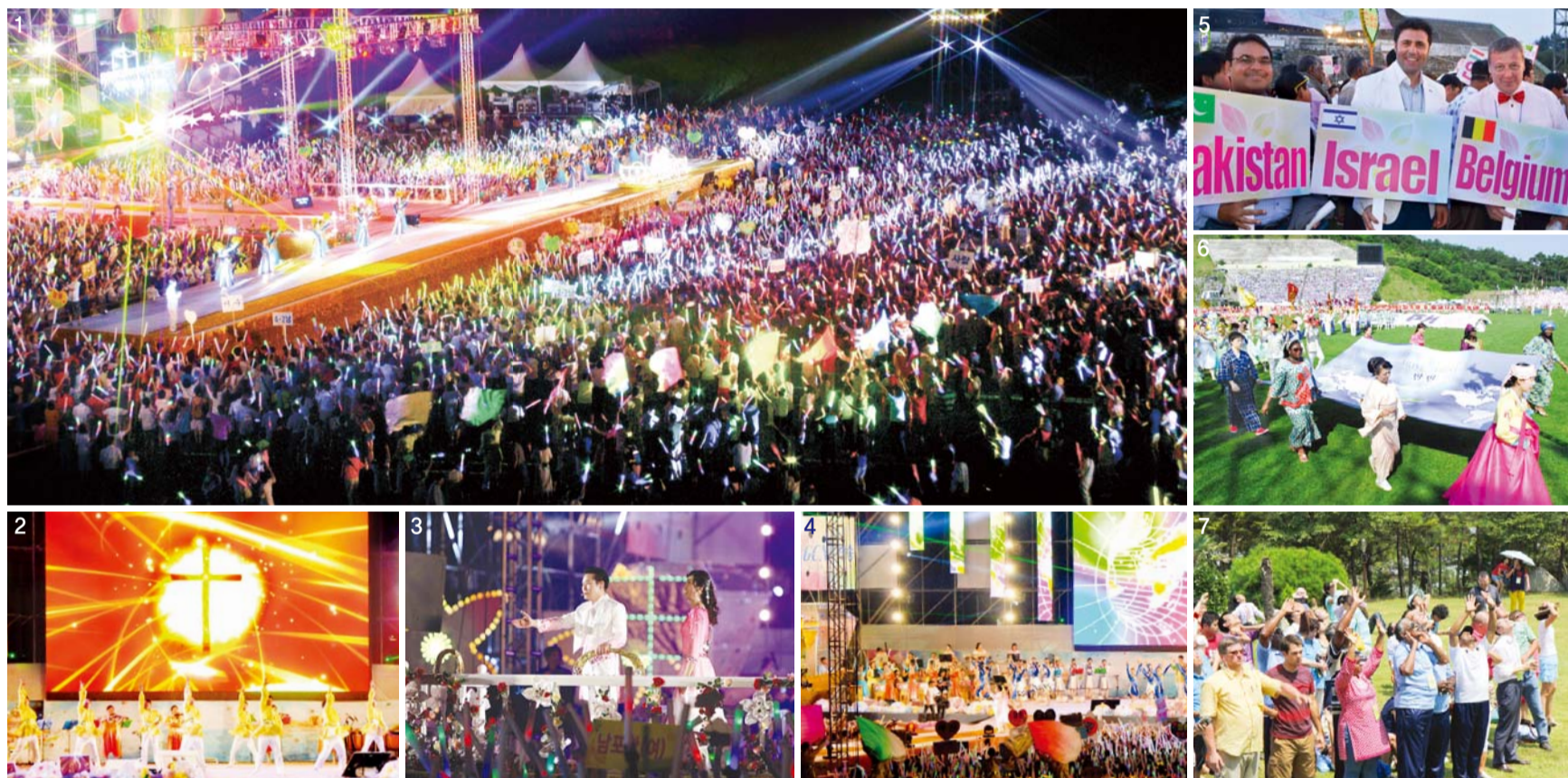
通过奇事和神迹彰显不断的“2013万民夏季修炼会”，海外牧会者及圣徒们自始至终体验圣灵的权能，得到更高层次的信心，同时与韩国国内圣徒们一起以爱心相互交流，凝造宝贵的回忆【图为修炼会第三天在全罗北道茂朱德裕山度假村滑道公园特设舞台举行的篝火聚会（1-5）；第二天运动大会（6）；最后一天访问通过权能祷告海边的咸水变甜水的奇迹现场——务安甜水圣地（7）】

拥有全世界一万余支、协教会的本祭坛，为了直到地极作主见证，长久致力于世界宣教事工。因此面见行神迹奇事、权能的堂会长李载禄牧师，亲身体会神应允与医治作工，是世界各地圣徒们信仰生活中的期盼。