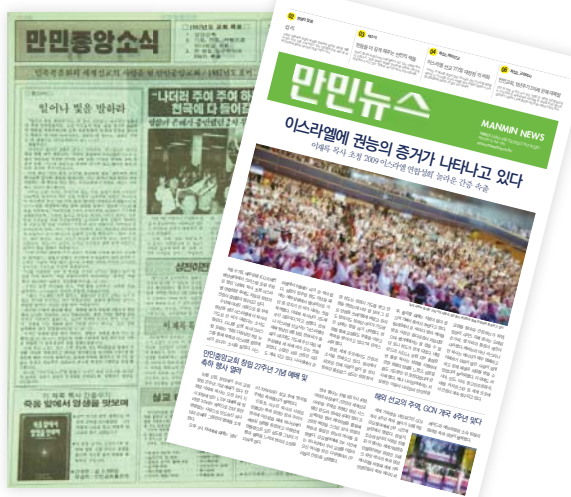
《万民新闻》创刊号(左)和更名后的期刊400号

将创造主神的权能、耶稣基督的福音及圣灵的作工传遍地极，引领无数灵魂归入得救之路的《万民新闻》韩文版，迎来刊期600号。1987年5月17日创刊的《万民中央消息》，开始以月刊，后以隔周刊形式发行。至2009年10月，在教会创立27周年之际，跃升为针对全世界万民的宣教信息报，更名《万民新闻》，改为周刊。