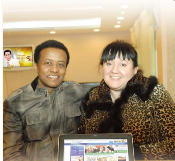
安东圣徒, 安吉拉圣徒(乌克兰哈尔科夫)