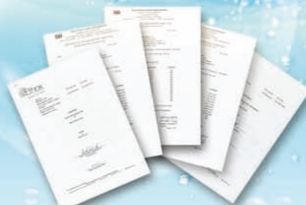
美国 FDA (食品药品监督管理局) 检查结果