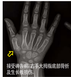
接受祷告前：右手大拇指底部骨折及生长板损伤。

圣洁好像从没受过伤似的，大拇指能够随意自如地活动。借此，我们全家人都体会到父神无微不至的爱，越发增长信心。将所有的感谢和荣耀都归于三一真神！