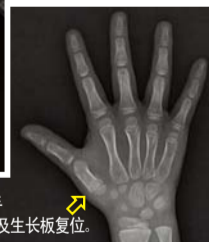
接受祷告后：右手大拇指底部骨折及生长板复位。