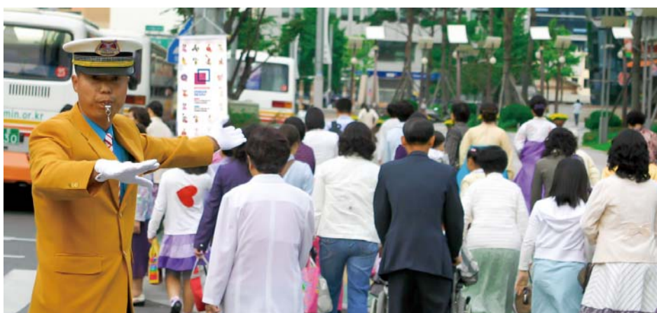
满怀对主恩的感激，切慕模成主心的盼望，本教会的青壮年及儿童们通过侍奉习得“关爱”和“服侍”这样的瑰宝。他们一致告白：“神所赐的喜乐与平安丰富有余，远远超出我所做的。”