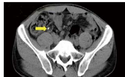
接受祷告后: 肿胀的阑尾恢复