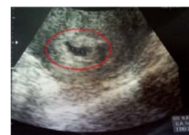
◀ 接受祷告后积血消失，胚胎种植保持正常。

如此短短五天就体验奇迹的丈夫开始了祷告生活，改变为时常称谢神宏恩大爱的信仰人。将所有感谢与荣耀归于神！