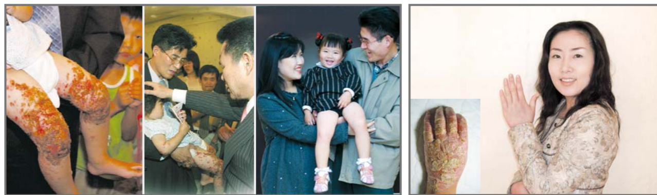
犹如受了烧伤一样不堪入目,接受祷告之后,在短短的三周内干干净净得医治的金雅瑟儿童。