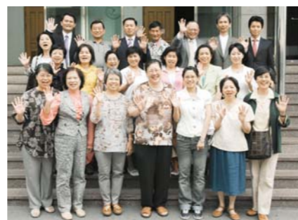
访问本教会的万民中华神学院学生们

曾在台湾设立此宣教机构而祷告。她所撒下的信心的种子已经在高岛百货公司、大北百货公司等各百货商场发芽成长。