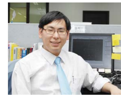
“祝贺你升职了！对了，该叫你白代理了。”