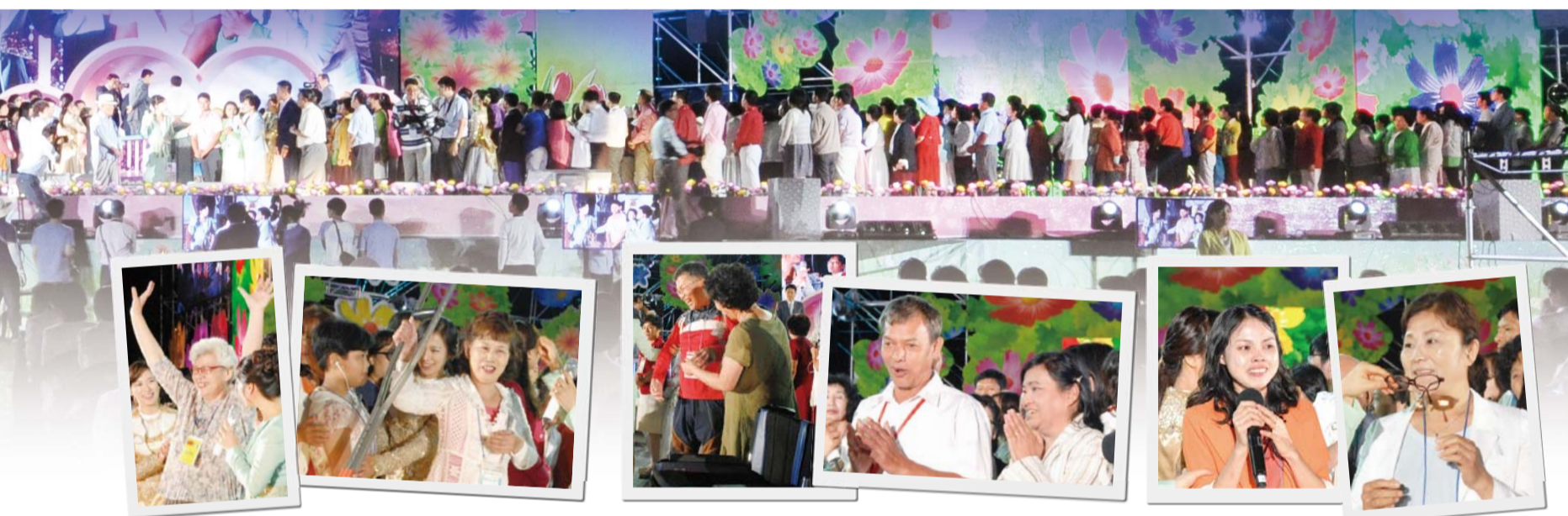
“不用拄拐也能行走了！”