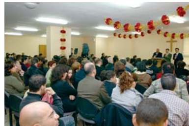
在耶稣的诞生地伯利恒地区带领圣诞礼拜

“第三次以色列宣教具有更为特殊的意义。这是一个具有很大属灵意义的事件。因为迎接圣诞节不仅在这地上，在属灵的世界里再次宣告耶稣是全人类的救主。仇敌魔鬼撒但该是多么憎恨此事呢！因为这是神和主的名再次在宇宙当中大得荣耀的惊人事件。”