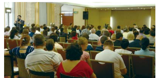
在耶路撒冷地区举行的第三次牧会者研习会

舍的当儿，一位牧师请求我停车，稍等片刻。他说有一个癌症患者正坐出租车前来接受祷告。过了片刻，患者到场，我便恳切地为他做了祷告。结果这位癌症患者完全洁净了。因为有这样的神迹常常伴随，所以牧会者们能够信赖我，拥有真信心，并与我们同心合意致力于福音事工。”