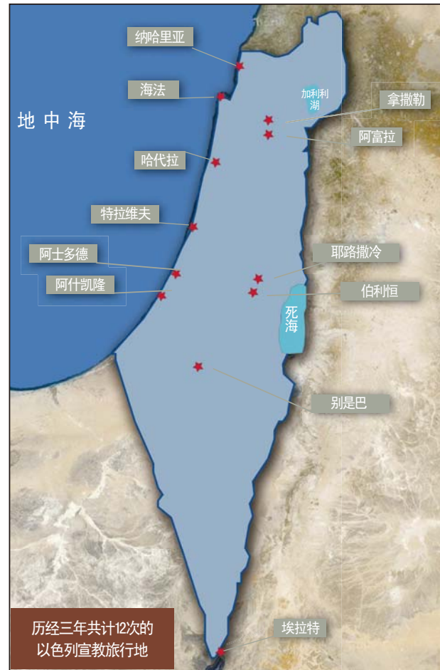
历经三年共计12次的以色列宣教旅行地

“借此成就了以色列第二次访问的最大目的——牧会者聚会。我向与会者们说明了神对以色列的计划和旨意，要求他们为以色列福音化与我们齐心协力。此次聚会意义深远，借此看出下次以色列访问的路子，并为与他们齐心协力奠定了基础。”