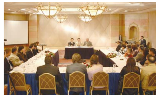
预备第三次以色列宣教的伯利恒牧会者聚会

“第三次以色列宣教具有更为特殊的意义。这是一个具有很大属灵意义的事件。因为迎接圣诞节不仅在这地上，在属灵的世界里再次宣告耶稣是全人类的救主。仇敌魔鬼撒但该是多么憎恨此事呢！因为这是神和主的名再次在宇宙当中大得荣耀的惊人事件。”