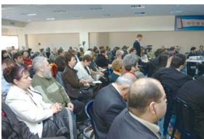
在阿士多德地区举办的第一次牧会者研习会