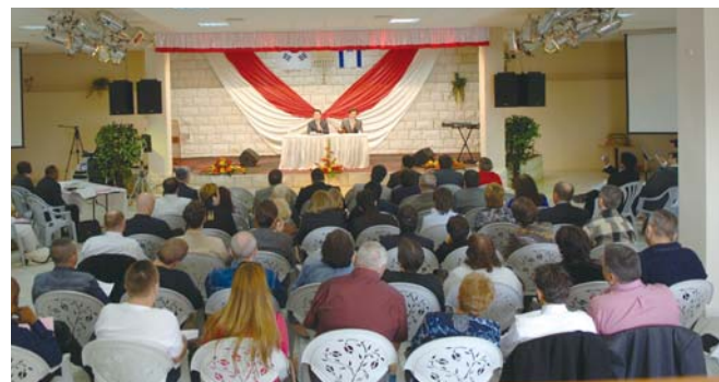
在拿撒勒地区举办的第二次牧会者研习会