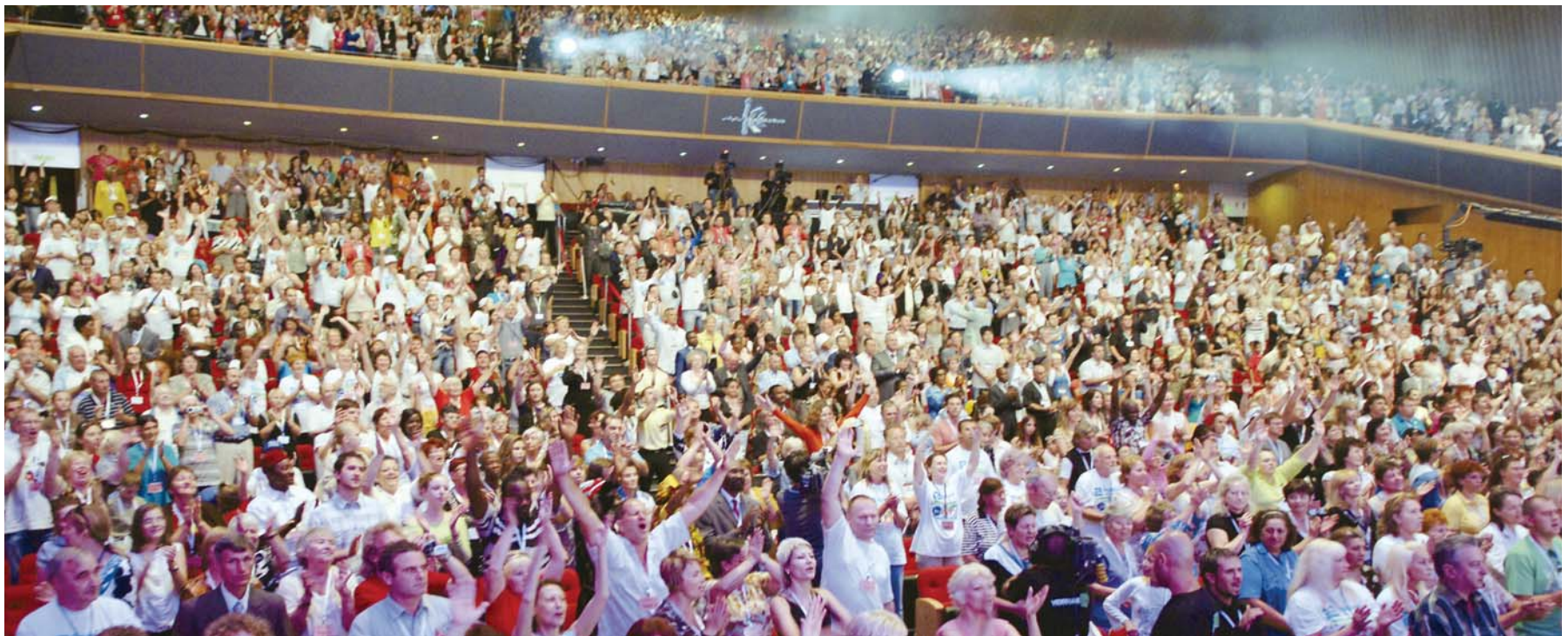
来自36个国家的教会领袖和圣徒们与演出团一同赞美欢呼

9月6日至7日，在“水晶论坛”的主办下，在耶路撒冷ICC（国际会议中心）圆满举行了“特邀李载禄牧师以色列联合盛会”。盛会虽然结束，但蒙医治和应允的见证却接连不断。