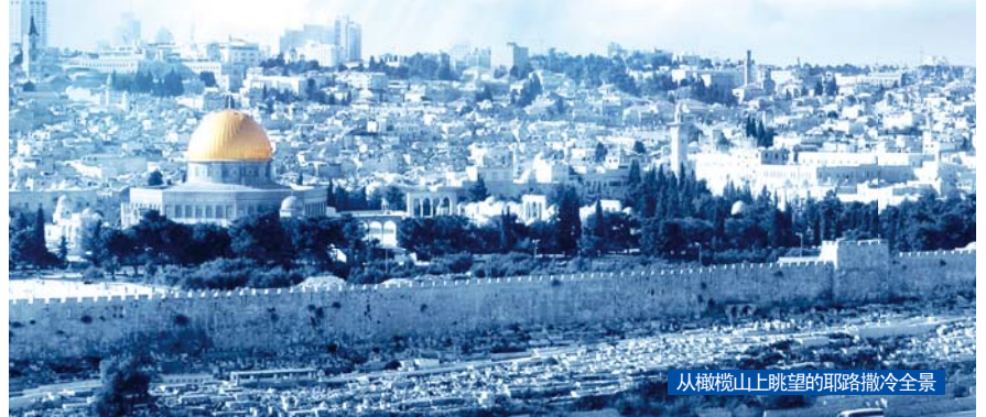
从橄榄山上眺望的耶路撒冷全景

舍的当儿，一位牧师请求我停车，稍等片刻。他说有一个癌症患者正坐出租车前来接受祷告。过了片刻，患者到场，我便恳切地为他做了祷告。结果这位癌症患者完全洁净了。因为有这样的神迹常常伴随，所以牧会者们能够信赖我，拥有真信心，并与我们同心合意致力于福音事工。”