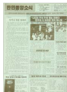
《万民中央消息》创刊号

这都是为了满足圣徒人数的爆发性增长的需求、更多新闻供应需求以及不断发展的海外宣教事工需求。