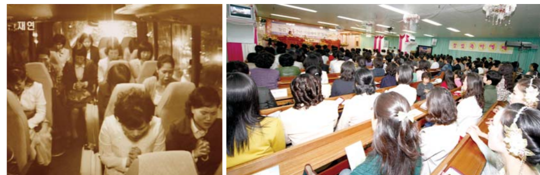
左边是教会开初期因没有礼拜场所而在教会大巴里献上礼拜的照片,24年之后的现在,在位于江浦区大峙洞“光和盐教会”自己的圣殿——岭东圣殿做礼拜。(10月28日下午9点30分,“创立24周年纪念礼拜”)

10月28日(周三)下午9点30分,“光和盐教会创立24周年纪念礼拜”在岭东圣殿进行。光和盐教会由从事流通业和餐饮业的圣徒们所组成的宣教团体,旨在帮助主日工作的人们,在主里面团聚,坚守信仰,并借以实现餐饮流通行业福音化。