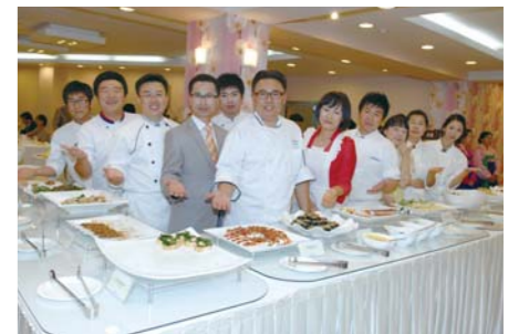
教会活动时做海外来宾接待侍奉工作的光和盐教会餐饮业会员们与侍奉者们。

社会生活而变成的冰冷之心灵被融化的感觉。她时常听到顾客和同僚们的称赞:“真是好姑娘,又亲切、又温和。”有的顾客试穿一堆衣服,弄得柜台凌乱不堪就转身离开,面对这样的顾客她还是以微笑相待,恭敬地对顾客说:“欢迎再次光临,没能预备您所需的商品真是对不起,下次定会摆上您称心如意的商品。”最近她得到素来器重她的公司老板的帮助,收购了一处服装卖场。她说:“尽管涉足零售业,但我没有陷入物质主义思潮,而能够一心盼望天国新耶路撒冷,追求有价值的人生,这跟光和盐教会的帮助是分不开的。”