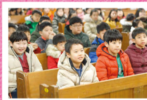
我的梦想和异象……“万民利未工人（教会专职人员）”作何担当？