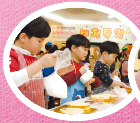
我的食谱，“爱心蛋糕”