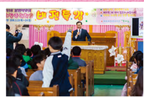
末时须灵里警醒……充满，充满，祷告充满！

2018年2月22日（周四）至24日（周六），儿童主日学校利用春假开设“梦想特讲”，在主里面为万民的儿童栽植梦想和异象。