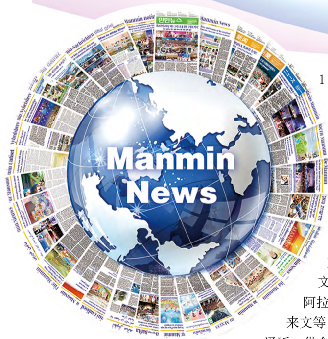
▲ 三十三种多国文字译版《万民新闻》

凭借生命之道和权能事工消息，将全世界万民领入得救之路的《万民新闻》迎来创刊三十一周年。《万民新闻》1987年5月