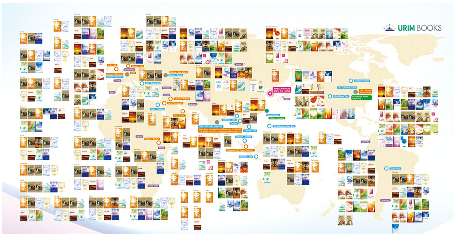
将全世界无数灵魂领入得救之路的文字宣教现况