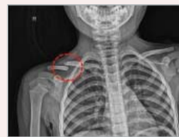
▲ 接受祷告前: 右侧锁骨骨折错位。