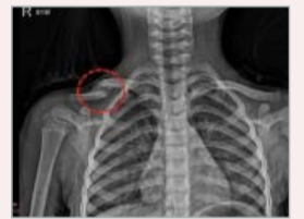
▲ 接受祷告后: 两端骨折处生骨痂, 顺利愈合。