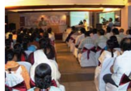
印度WCDN海得拉巴研习会

治的事例。以此为契机印度WCDN正式开始运作，为成就印度福音化打下了坚实的基础。曾在泰米尔纳德邦Nachiyaar Koil市和崔奇(Trichy)市、安得拉邦海得拉巴市、喀拉拉邦的特里凡得琅(Trivandrum)市和喀拉昆伦医科大学举办了研讨会。除此以外还在首都新德里召开了为研讨会筹备会议等，用圣洁福音和神的权能唤醒着许多医务工作者和知识阶层。