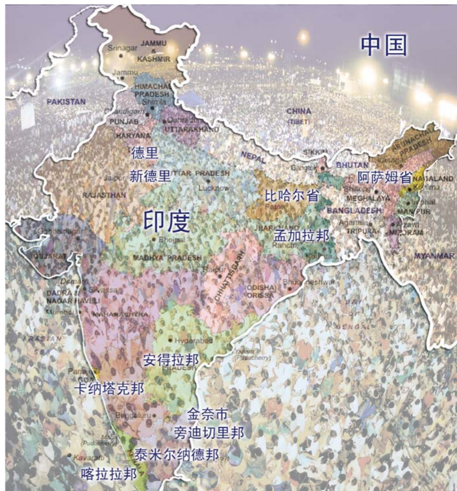
2002年10月10日至13日，在印度泰米尔纳德邦金奈市玛丽娜海边举行的“特邀李载祿牧师印度联合大盛会”，参加人数达到了300万人次，创下了印度基督教历史上聚会人数最多的记录。

在泰米尔纳德邦和旁迪切里邦等，万民各支、协力教会都通过GCN-万民电视节目献上实时影像礼拜。通过2002年印度联合大盛会、特邀李美京牧师手帕盛会(徒19：11-12)以及2007年泰米