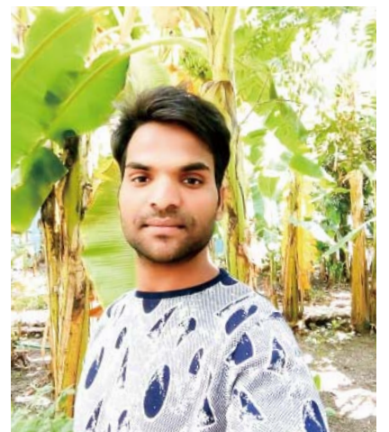
凯拉什弟兄 (26岁, 印度印多尔市)

“GCNTV HINDI”参加直播礼拜。堂会长的证道信息乃是在哪里都听不到的生命之道。切盼成为蒙主合用的器皿, 将这蒙福佳讯传给无数印度灵魂。