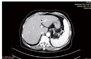
▲ 接受祷告后：肝硬化引起的腹水全消不见