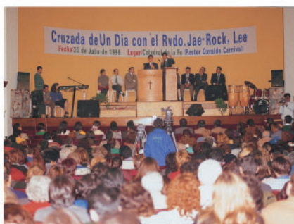
▼ 1996年阿根廷牧会者研习会及奋兴会等

在地球的另一边，阿根廷向敬爱的堂会长以及万民中央教会表示感谢，我们是“万民”，我们在“万民”里靠主合一。