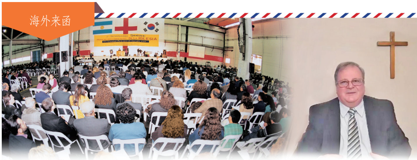
▲ 1997年阿根廷牧会者研习会及奋兴会