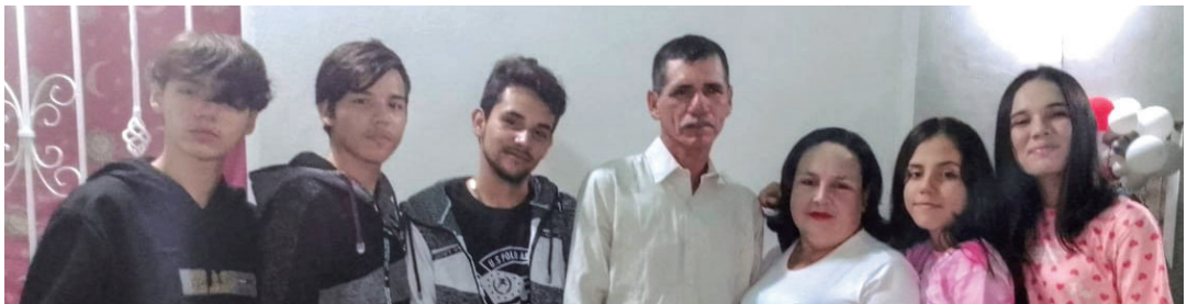
玛尔塔·阿马伽圣徒(右三)一家