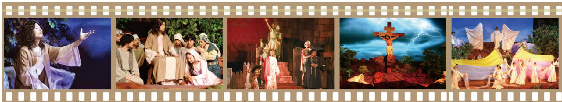
第一幕 福音：背负十字架的耶稣在客西马尼山上双膝跪地向神祷告的身影中，切切感受主耶稣对众灵魂的那份大爱。 第二幕 圣工：耶稣所传的天国福音和所彰显的权能，对于生活在悲伤和痛苦中的百姓来说，是生命的救赎，是痛苦的解脱。 第三幕 受难：让主耶稣痛苦的并不是头戴荆棘冠冕，肩背上沉重的十字架，罗马兵丁的鞭打等肉体的疼痛，而是荒废的灵魂使他心痛。 第四幕 十字架：神的独生子耶稣瞬间天地都被深黑的黑暗所笼罩，主耶稣的最后一口气震动了大地。 第五幕 主的复活：第一个见到主的复活，并听到主的声音的抹大拉的马利亚向世界喊“主复活了！”