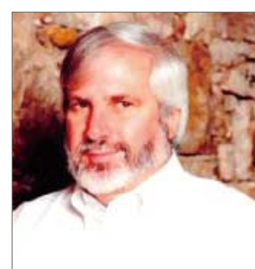
今年的教师瑞克·乔伊纳

澳洲悉尼hillson教会堂会长布赖恩·休斯顿牧师被选为2009年今年最佳赞美事工者，hillson教会在全世界许多国家的首都拥有支教会。休斯顿牧师和其团队开始将他们的赞美事工上传到了因特网上，结果hillson团队制作的新赞美专辑在网上排行榜位居世界榜首，因特网下载次数也位居榜首。他们的事工通过Hillson电视台的“我们如今合而为一”节目被广泛宣传。