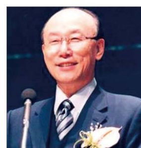
今年的牧会者赵勇基

与第一位妻子离婚后，2008年瑞克·乔伊纳暂时停止了宣教事工，他也是托德·本特利（Todd Bentley）的属灵恩师、“晨星事工”的代表，他也被选定为2009年今年的最佳基督教领袖。瑞克·乔伊纳与托德·本特利，以及他的新任妻子一起接受录像采访时谈论一些年轻牧会者身上发生的根本问题，教导其他许多基督徒能够避免将来遇到同样的问题。