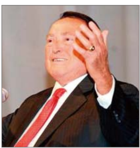
今年的复兴讲师莫里斯·谢纶络

约翰·麦克斯韦作为最著名的基督徒作家之一，2009年在因特网上被评价为社会知名人士。如今的他成功基督徒的人生原则拥有更多分享的机会，不管是基督徒还是外邦人，此书持续带给许多人极大的影响。