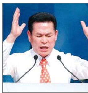
今年的电视讲道人李载禄

复兴讲师莫里斯·谢纶络的名可谓享誉世界各地，2009年他巡回苏联各国展开了福音事工，他以牧师和教会领袖以及传道师为对象举办了研习会，传授了成功的传道之法。莫里斯·谢纶络每次引导研习会都携带自己的孙子，如今孙子也继承爷爷投入到了福音事工中。