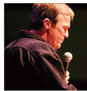
今年的祷告之人迈克尔·比克尔

T.D·杰克斯牧师是世界最著名的讲道人之一，牧养美国最大教会。2009年他访问了乌克兰基辅，访问目的就是通过举办研习会给数千名俄语圈基督徒们传福音，让数百万人通过电视收看研习会。2009年美国经济的萧条丝毫没有影响T.D·杰克斯牧师，反而为福音事工取得发展带来了更多影响力。