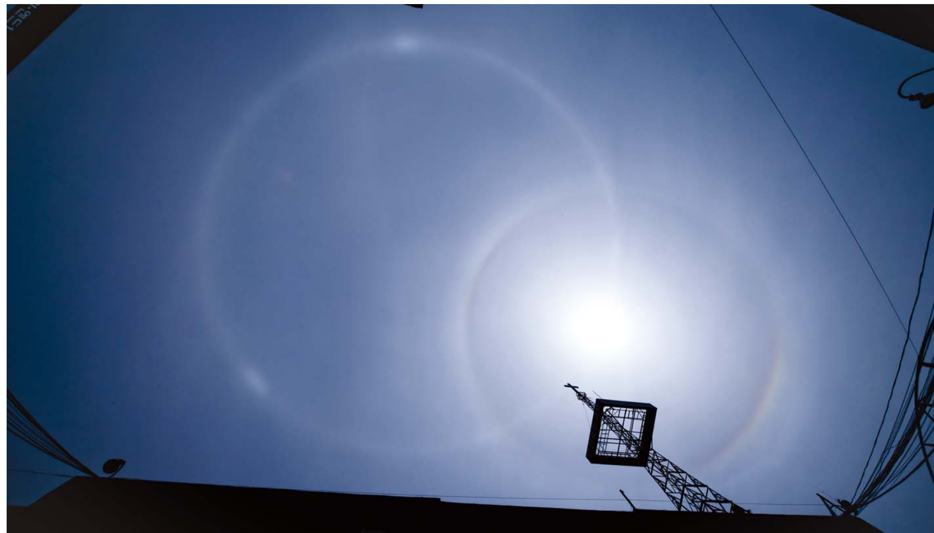
最近世界因频发的自然灾害以及政治、经济、社会全联动混乱，这钻戒模样的彩虹显现在幽暗的这世界，发出明亮的真光，充当神不变之应许的记号——神通过万民要成就祝福之应许，必然成就。( | Canon EOS 5D Mark II | Sigma 12-24mm | 1/500 s | F18 | ISO100 | 2010-04-14 11:31:19)

4月14日，上午9点30分左右至11点30分，在教会十字架塔上空显现了奇特的彩虹，共持续了2个小时以上。耀眼的太阳如同镶嵌在戒指上的钻石一般，这钻戒模样的彩虹又与围绕太阳的圆形彩虹重叠在一起。