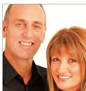
今年的赞美事工者布赖恩·休斯顿

美国著名牧会者马鞍峰教会（saddleback church）堂会长瑞克·沃伦牧师被选为2009年新闻明星。他曾在奥巴马总统就任仪式中做了代表祷告，作为维护基督徒利益的辩护人，他的名字在新闻提要中出现的次数比任何一名牧会者的名字都要多。