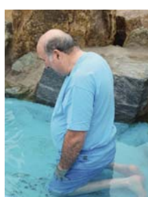
▶ 在务安甜水中浸水之前凭信心向神祷告