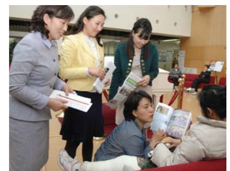
4月27日，本教会12-1教区地区义工们访问医院，带着《万民新闻》和《今日万民》，正在给来院看病的患者们传福音。

没有传福音的人，世人怎能听福音？所以传道非常重要(罗马书10章14节)。如果一个本该得救的灵魂，却因没有听到福音而去了地狱，这多么令人惋惜！尽管如此，有些人却借口说：“因为忙没有时间传道；性格内向不善于言词。”然而，传道并不是传也可、不传也可的选项。因为传道是主的至上命令，也是我们义不容辞的使命。