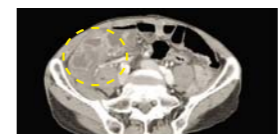
接受祷告之前：显示肠严重水肿，因肠道过敏，肠内无法形成大便。