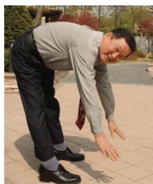
能这样弯腰真是太幸福了！

这时郑振英教区长勉励我借着“两回连续特别但以理彻夜祷告会”一心仰望神，靠着信心得到医治，他还说：要想蒙神医治必须首先悔改以往的过错。3月，“两回连续特别但以理彻夜祷告会”正在如火如荼进行的某一天，恍然醒悟以往诸