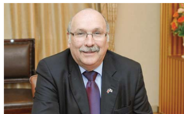
盖恩·奥尔特·马塞尔·莫勒牧师(哥斯达黎加国会议员)

两天后，在首尔大学医院拍摄X光照片检查结果，腰部没有发现任何异常，没有必要做手术。哈利路亚！