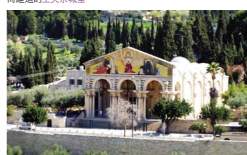
在主耶稣经常上山祷告的地方——橄榄山（路加福音22章44节）上建造的万国（万民）教堂