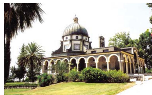
在传说主耶稣曾教训八福（马太福音5章1-10节）的八福山上建造的八福教堂