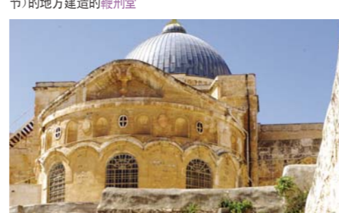
纪念主耶稣的死亡和复活（约翰福音20章1-8节），在耶稣的坟墓上面建造的圣墓堂