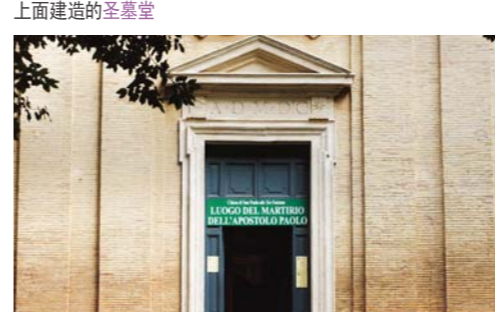
在使徒保罗被处决处建造的保罗殉道纪念馆

“你是基督，是永生神的儿子。”主耶稣听到彼得这一告白，就对他：“你是彼得，我要把我的教会建造在这磐石上，阴间的权柄不能胜过他（“权柄”原文作“门”）。我要把天国的钥匙给你……。”（马太福音16章16-19节）从此开始耶稣把十字架的苦难和受死、复活的事告诉门徒们，并照着神的旨意，完成教主的使命。因此，借着领受圣灵的门徒们，福音传遍了耶路撒冷、犹太全地和撒玛利亚，直到地极，并在全世界各地建立了无数教会。