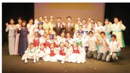
7月8日（周四）晚7时，在日本饭田市木偶剧场举行的“夏日夏季音乐会”上，由饭田万民教会艺术队和MMTC短笛童声队正在进行联合演出，当天共有200多名观众出席观看了演出。