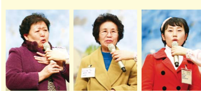
尿道结石蒙神医治的 白云载弟兄(首尔, 28岁)