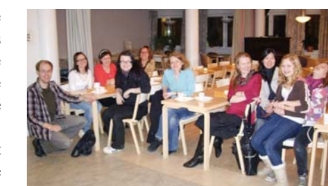
Communion fraternelle avec des frères préparant un culte de louanges à 'Freedom Church' en Finlande.