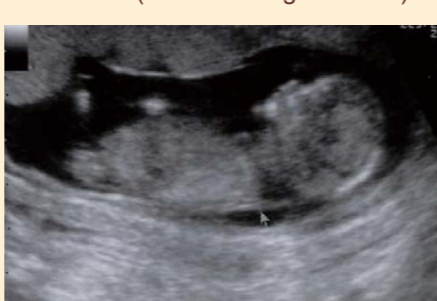
L'échographie d'une femme enceinte normale (six mois de grossesse)

♦ La partie noire qui recouvre le fœtus est le liquide amniotique.