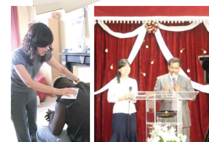
Visite auprès d'un frère qui avait été guéri de la dépendance à la drogue et prière avec le mouchoir Prêchant un sermon à Holy God TV en France