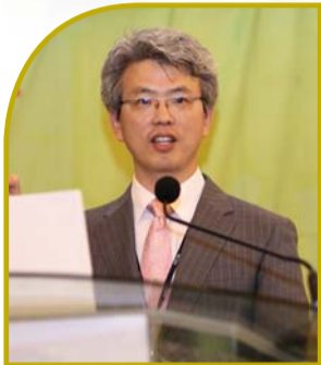
Cas présenté par le Dr. Chang Kyu Yang Médecin, Radiologue

J'ai fait des présentations de cas de disque lombaire, de tendinite et d'inflammation de calcification et d'abcès thoracique lors des 1ère, 2ème et 6ème Conférences Médicales Chrétiennes Internationales. Les cas ont une chose en commun. Les patients ne se sont pas reposés sur la médecine, mais ont reçu leur guérison avec foi en Dieu et par la prière puissante. Dans le cas que j'ai présenté lors de cette conférence, le patient a été guéri du cancer sans traitement médical.