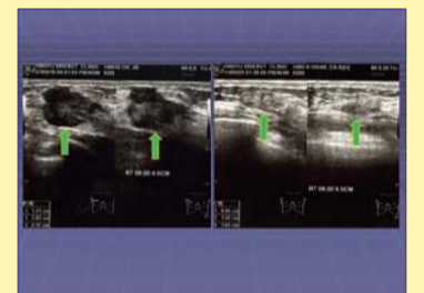
Ultrasonographie: un nodule homogène de la taille de 2,17cm a disparu