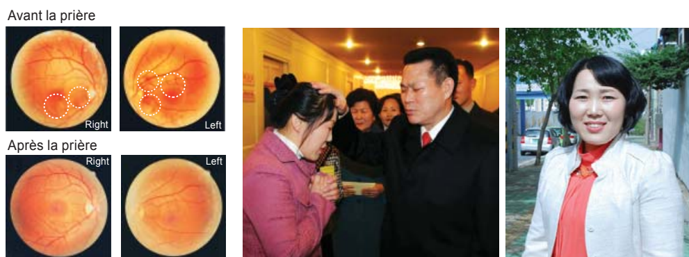
Le rétinographe montre que le kyste dans chaque œil avait disparu. Sa vision a aussi récupéré de 0.8/0.25 à 1.0/1.0.

Alors, tout ce qu'elle voyait flou et jaune est redevenu normal. Elle a eu un nouvel examen qui a démontré que tout était redevenu normal. Sa vision était de 0.8/0.25 avant la prière mais elle a évolué vers 1.0/1.0 après la prière. Après cela, sa vision s'est encore améliorée vers 1.2/1.2. Normalement il faut près de six mois pour que la maladie de Harada soit complètement guérie dans un hôpital, mais elle a été guérie en seulement deux semaines et elle a été sauvée du danger de cécité. C'est étonnant.