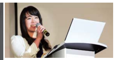
Elle témoignait de son cas de guérison lors de la 10ème Conférence Internationale Médicale Chrétienne du WCDN au Mexique