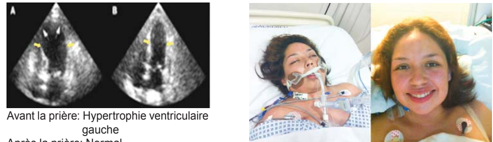
Avant la prière: Hypertrophie ventriculaire gauche Après la prière: Normal