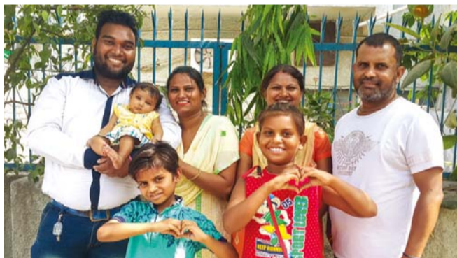
▲ ガビタ聖徒の家族(左から夫と娘、ガビタ聖徒、姉、姉の夫、前列甥と姪)

祝福はここで終わらず、主人が会社から資金を回収するようになって、借金も全部清算しました。このように絶望を希望に変えてくださった神様に感謝と栄光をお帰しし、祈ってくださいました堂会長先生に感謝いたします。