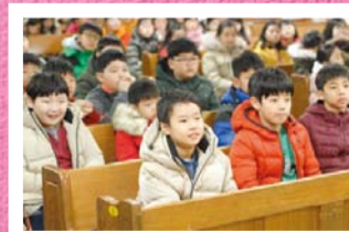
私の夢とビジョン「万民教会の職員はどんな仕事をしているのでしょうか？」