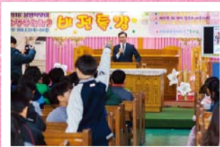
終わりの時、霊的に目覚めているために～満ち満ち、祈り満ちて！

教会学校は今年2月22日(木)から24日(土)まで「ビジョン特講」を開き、春休み中の万民の子どもたちに主にあって夢とビジョンを与える意味深い時間を持った。