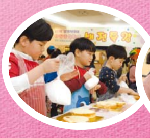
私だけのレシピ、「ラブリーケーキ」