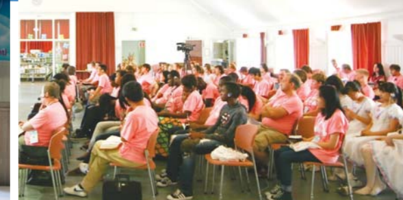
第4回「十字架のことはばキャンプ」には11か国の青少年が参加、セミナーでイエス・キリストの十字架の救いの摂理を悟り、各国の文化を体験した。

MMTC(マンミン世界宣教訓練院)主催第4回「十字架のことはばキャンプ」が7月19日から23日までフィンランドのヘルシンキで「Arise, Shine」(起きよ。光を放て;イザヤ60:1)というテーマで開かれた。