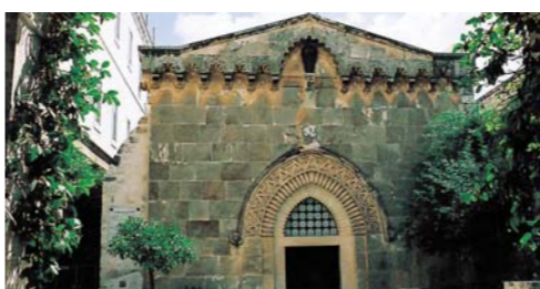
ローマ兵がイエス様にいばらの冠をかぶせてもちで打った(ヨハネ19:1-3)所に建てられた「鞭打ちの教会」