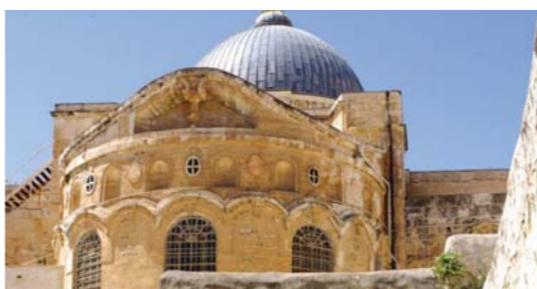
イエス様の死と復活を(ヨハネ20:1-8)記念して、主の墓の上に建てられた「聖墳墓教会」