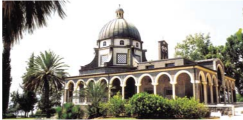
イエス様が八つの幸いを教えられた(マタイ5:1-10)と伝えられる「山上の垂訓教会」