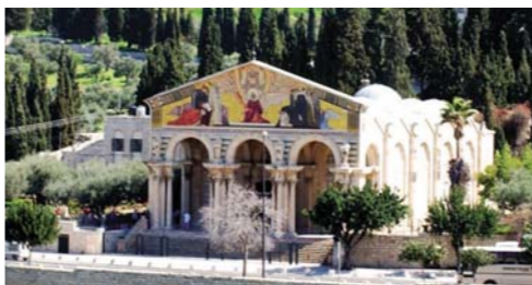
イエス様がいつものように折られたオリーブ山(ルカ22:44)に建てられた「万国(万民)教会」