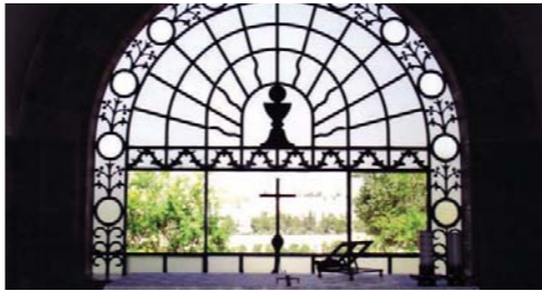
イエス様がエルサレムを見て泣かれた(ルカ19:41-42)ことを記念して建てられた「主の泣かれた教会」