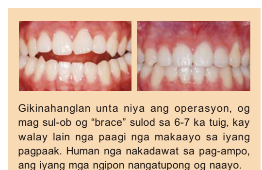
Gikinahanglan unta niya ang operasyon, og mag sul-ob og "brace" sulod sa 6-7 ka tuig, kay walay lain nga paagi nga makaayo sa iyang pagpaak. Human nga nakadawat sa pag-ampo, ang iyang mga ngipon nangatupong og naayo.

Naa pa akoy usa ka talagsaong panghimatuud. Ang porma sa akong nawong nausab samtang nagtambong sa "Two Term Consecutive Special Daniel Prayer Meeting". Naa koy lantip, eskinado, bali nga triangulong porma sa nawong, nga dili mindot tan-awon hilabi na gyud og akong bugkusan ang akong buhok sa likod. Karon naa na akoy "oval shape" nga nawong, mahimo nag akong hipuson ang akong buhok sa luyo. Ako kinasingkasing magpasalamat sa Ginoo, nga motugot sa tawong sama nako nga walay nahimo sa Pulong sa Diyos, nga maka eksperyensiya sa iyang gamhanang lihoc og mahimong magtotoo nga sama sa lagus.