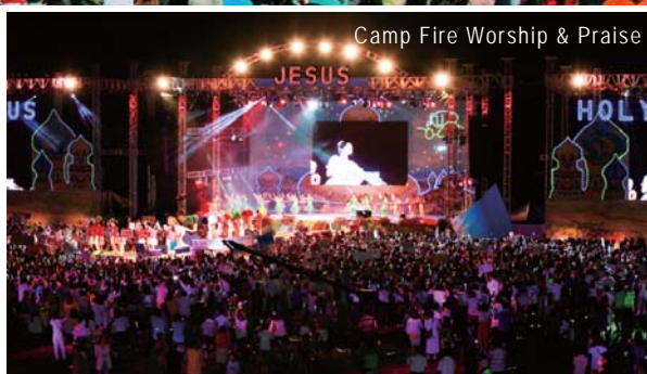
Camp Fire Worship & Praise

Ang Manmin Men's and Women's Missions' Summer Retreat gihimo didto sa Deogyusan Resort sa Muju, probinsya sa Jeonbuk. Sugod Agosto 6 og padayon sa tulo ka adlaw, ang mga miyembro sa simbahan nakakat-on sa dughan sa Diyos nga Espiritu og nitubo ang ilang pagtuo pinaagi sa nagkalain-laing programa.