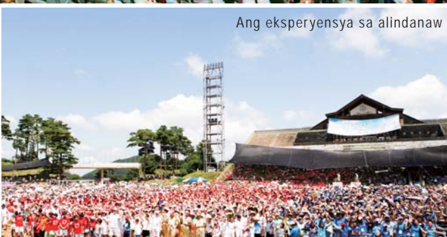
Ang eksperyensya sa alindanaw