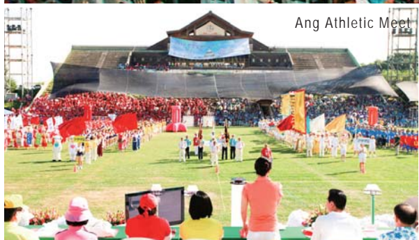
Ang Athletic Meet