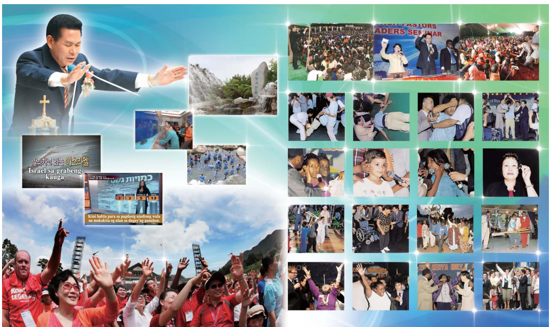
Daghang mga ilhanan og kahibulongang nangahitabo sa Manmin Central Church sama sa nanag unang simbahan. Ang Diyos nagpakita sa pagpamuhat, pag kontrola sa kinabuhi, og ang pag gamit sa espirituhanong kawanangan, nga diin daghang mga kalag ang nagiyahan sa dalan sa kaluwasan. Pinaagi adtong mga gamhanang mga milagro, sunod-sunod ang mga revival sa simbahan, og nakahimo sa duolan sa 10,000 ka mga sanggang simbahan og nakig ubang simbahan sa tibuok kalibutan.

Sama sa Nanag-unang Simbahan nga Daghan ang mga Ilhanan og Kahibulongan nga Nangahitabo