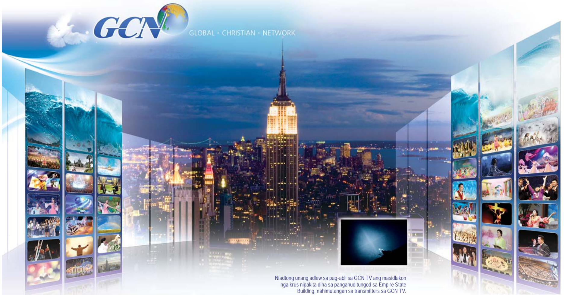
Niadtong unang adlaw sa pag-abli sa GCN TV ang masidlakon nga krus nipakita diha sa panganud tungod sa Empire State Building, nahimutangan sa transmitters sa GCN TV.

Ang Christian TV para sa Manan-away sa 170 ka mga Nasod