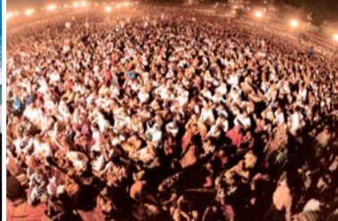
2000 Pakistan United Crusade