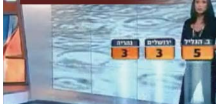
Makadasig nga balita para nato nga wala na makakita og ulan sa dugay’ng panahon.