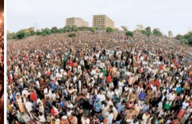
2001 Kenya Holy Gospel Crusade