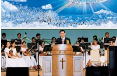
2000 Nagoya Miracle Convention