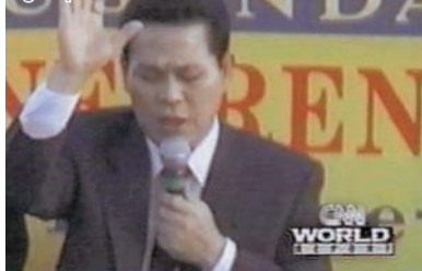
2000 Uganda Holy Gospel Crusade nga gi-report sa CNN