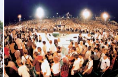
2001 Philippine United Crusade