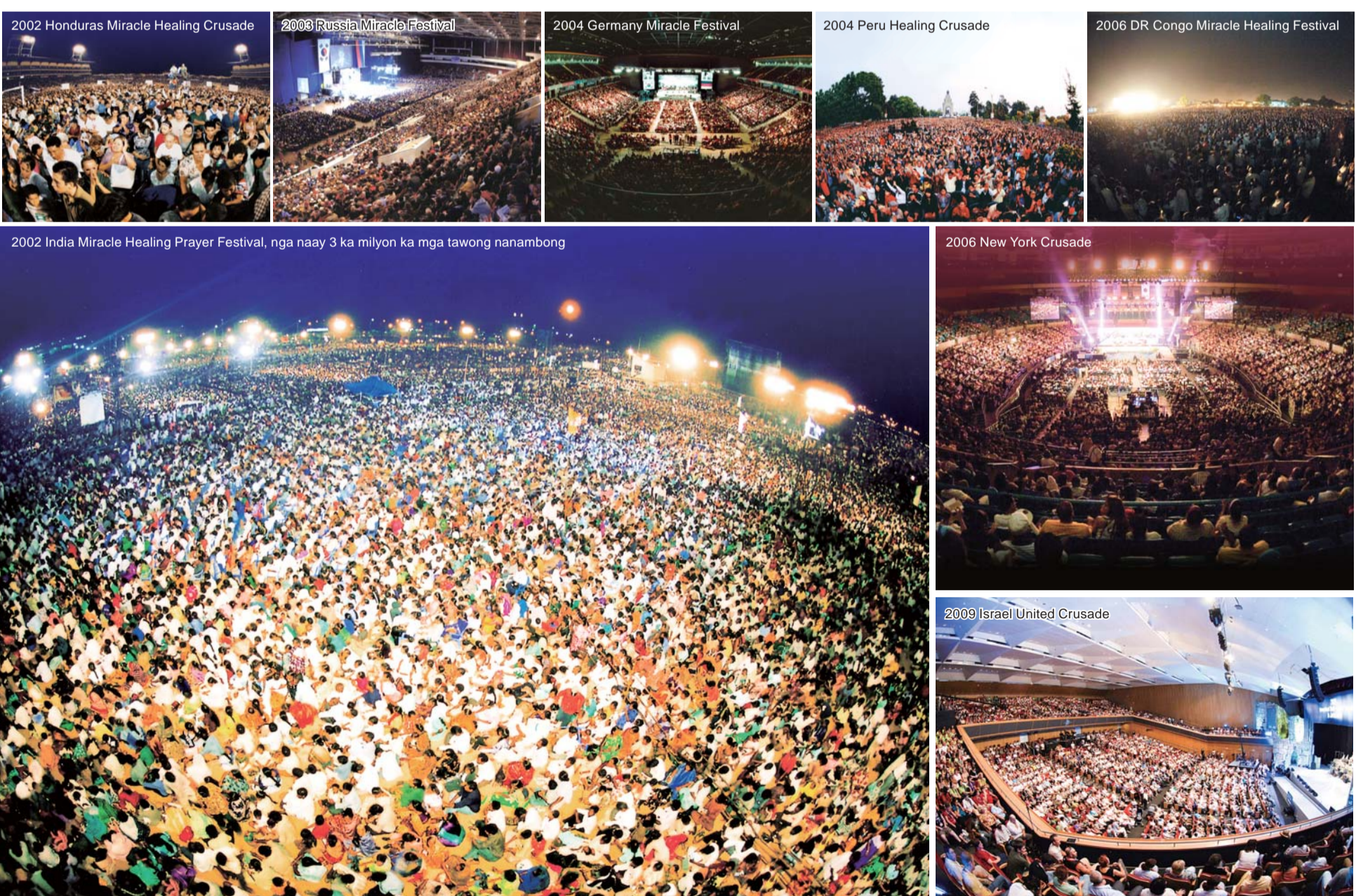
2002 Honduras Miracle Healing Crusade