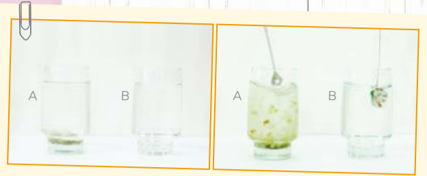
Ang baso A ug B dunay parehong limpyong tubig kon imong pasiplatan, apan naay mga bas kinaubsan sa glass-A (wala nga litrato). Kon ang tubig sa duha ka baso kutawon sa kutsara, ang tubig sa glass A mahimong hugaw, ug ang naa sa glass-B magpabilin nga limpyo ug tin-aw (tuo nga litrato). Makahatag usab kini nato ug panghunahuna nga bisan kita mahimong hingpit ug maayo sa bisan unsang hitabo kana human sa atong pagpapahawa sa tanang matang sa daotan dinhi sa atong dughan.

“Kinahanglang magmahingpit kamo ingon hingpit ang inyong Amahan nga tua sa langit” (Mateo 5:48).