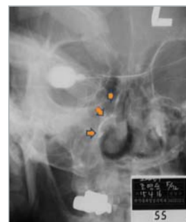
◀ Dacryocystography: ang contrast-media nagmaayo ngadto sa nasal-cavity diha sa tuong 'ductus nasolacrimalis'

Ang iyang 'nasolacrimal duct obstruction' wala maayo sa midisina, apan pinaagi sa pag ampo. Kahibulongan. Human sa presentasyon, daghang Kristohanong doktor ang nag saulog og naghimaya sa Dios.