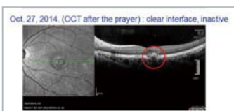
▶ Human sa pag ampo: clear interface, inactive