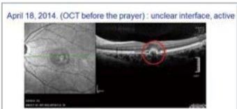
◀ Sa wala pa ang pag ampo: unclear interface, active