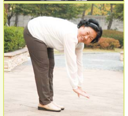
Human sa pag ampo, naayo ang iyang L4 og L5 herniated disc nga niapekto sa iyang mga ugat ugat