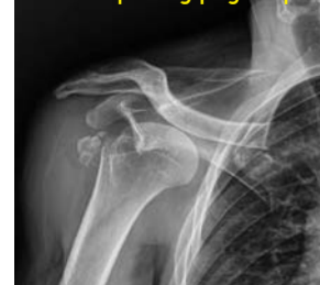
Sa wala pa ang pag ampo

Tungod sa external injury, ang tuong abaga nalisa og dakong tuberosity sa humerus na dugmok.