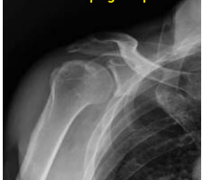
Human sa pag ampo

Ang nanga dugmok nga bahin sa tuberosity sa humerus nauli sa lugar nga murag resulta sa operasyon og ang mga nalisang bukog nahig-uli.