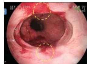
▲ pagdugo og paghubag sa tiyan paingon sa tungol