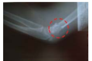
► Ang kataposan sa ‘humerus’ kompletong nabuak og wala na sa lugar.