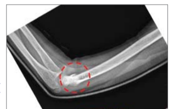
► Ang nabuak nga parti naanay insaktong bone-healing fluid, og walay timailhan sa pagmubo.