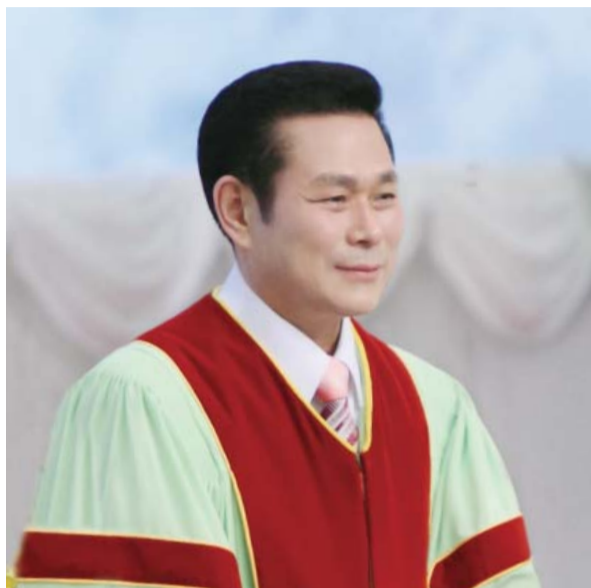
Старши пастор д-р Джейрок Лий

„Не изговаряй напразно името на Господа твоя Бог; защото Господ няма да счита безгрешен онзи, който изговаря напразно името Му“ (Изход 20:7).