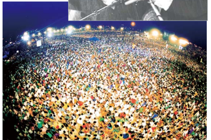
На обединената мисия в Индия през 2002 г. присъствали повече от три милиона души. По време на мисията намаля голямата суша. Много хора бяха излекувани и приеха християнството.