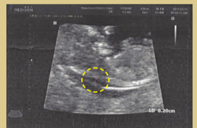
След молитвата Кожата става тънка до 2 мм