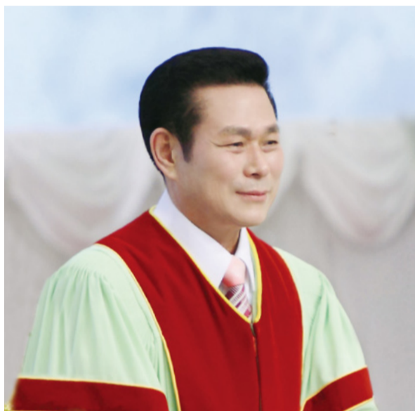
Старши пастор д-р Джейрок Лий

„А Исус, като видя майка Си и ученика, когото обичаше, който стоеше близо, каза на майка Си: „Жено, ето син ти!“ После каза на ученика: Ето майка ти! И от онзи час ученикът я прибра у дома си“ (Йоан 19:26-27).