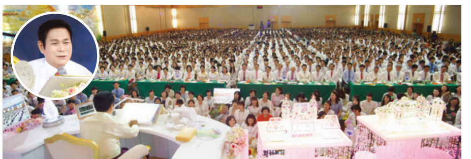
▼ Муджу, провинция Джинбук, където се провежда оттеглянето за молитви, бе изключена от картата за предупреждение за високи температури.

От 2011 г., Конференцията на ръководителите се провежда всяка година за вярващите, за да живеят с дух и цялостен дух.