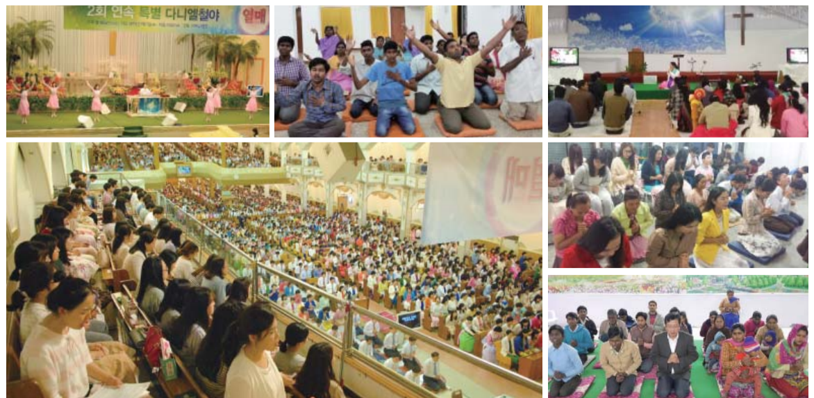
Manmins medlemmer over hele verden har fået Guds svar og velsignelser ved at bede ved Daniel bønnemøderne (Foto: Det ekstraordinære Daniel Bønnemøde i 2015: Medlemmer fra søsterkirker i Indien, Nepal og Thailand beder ved Daniel Bønnemøderne).

(Koreansk tid, GMT +9). Præmieceremonien vil blive afholdt d. 10. april. Den indledende lovsang begynder kl. 20.40 hver aften og ledes af medlemmer af komiteen for scenekunstnere. Fra mandag til torsdag foregår mødet fra kl. 21 til kl. 23.40; lørdag og søndag til kl. 23. Og om fredagen afholdes der nattelang fredagsgudstjeneste. Alle kan deltage i bønnerne via kirkens hjemmeside www.manmin.org .