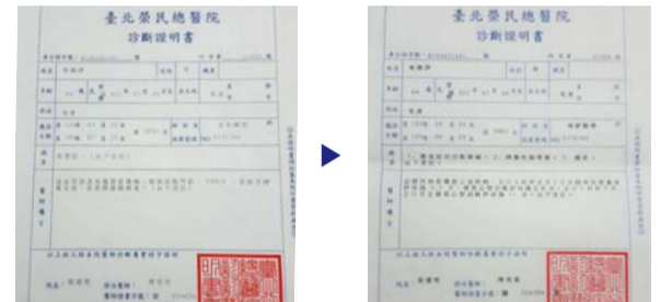
Før bønnen, diagnosticeret med demens (venstre) Efter bønnen, ingen symptomer på demens med CDR score 1 (højre)