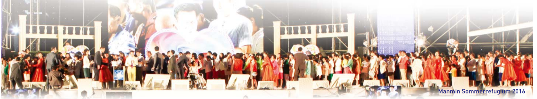
Manmin Sommerrefugium 2016

Manmin Sommerrefugium afholdes i begyndelsen af august hvert år, og mange mennesker bliver helbredt for forskellige sygdomme inklusiv AIDS, depression, hjertestop, hjerneblødning, demens og blindhed. Lad os høre fra dem, som bærer vidnesbyrd om deres helbredelse.