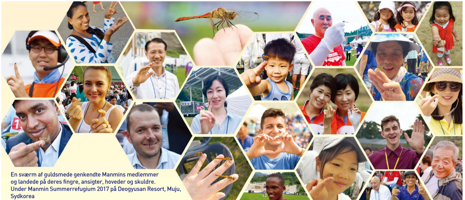
En sværm af guldsmede genkendte Manmins medlemmer og landede på deres fingre, ansigter, hoveder og skuldre. Under Manmin Summerrefugium 2017 på Deogyusan Resort, Muju, Sydkorea