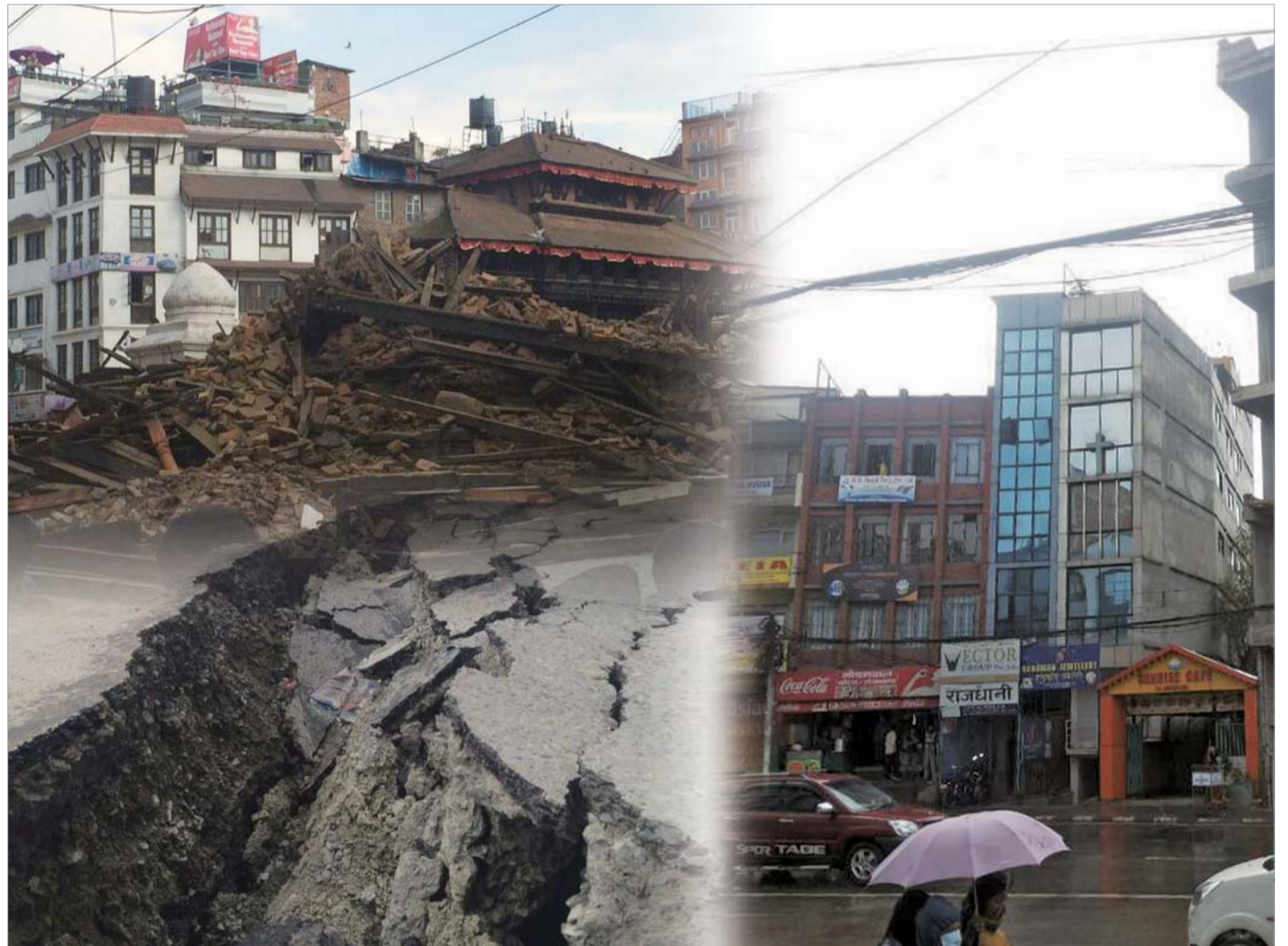
De grote aardbeving in Nepal heeft het leven van duizenden mensen gekost. Laat ons bidden dat er geen schade meer komt en dat de mensen niet zullen lijden onder verdere trauma's. Bovendien, laat ons Gods gezegende kinderen worden, die altijd door Hem worden beschermt en Hem de glorie daarvoor geven.

Op 15 juli 2014, was het nacht in de Filipijnen, toen een soortgelijk